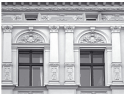
Auch für Denkmalschutz geeignet