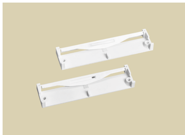
1 Paar Fensterfalzlüfter FFL